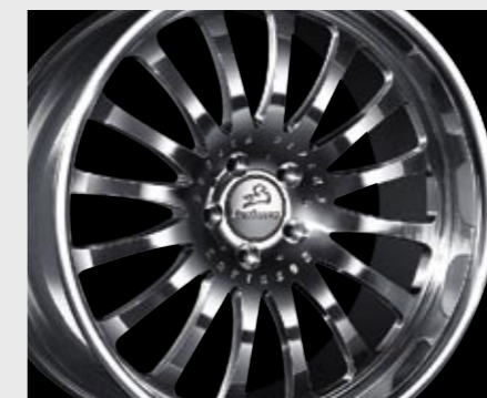
Aluminiumrad 1/16 Ultra Light (11x20") Aluminium wheel 1/16 Ultra Light (11x20")