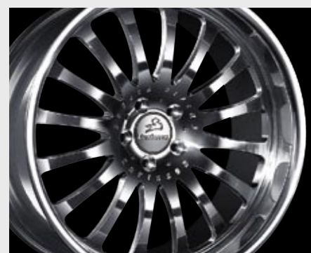
Schmiederad 1/16 Ultra Light (10x19") Forged wheel 1/16 Ultra Light (10x19")