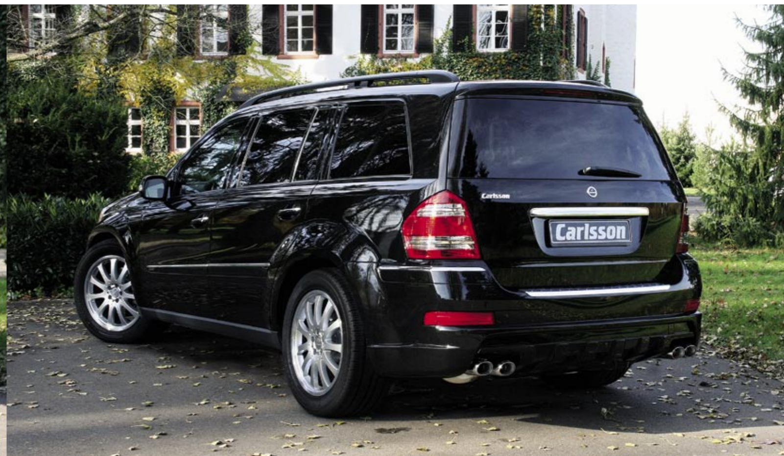
Aluminiumrad 1/11 Brilliant Edition (VA 9,5x20", 305/45 ZR 20 – HA 9,5x20", 305/45 ZR 20) Aluminium wheel 1/11 Brilliant Edition (FA 9,5x20", 305/45 ZR 20 – RA 9,5x20", 305/45 ZR 20)