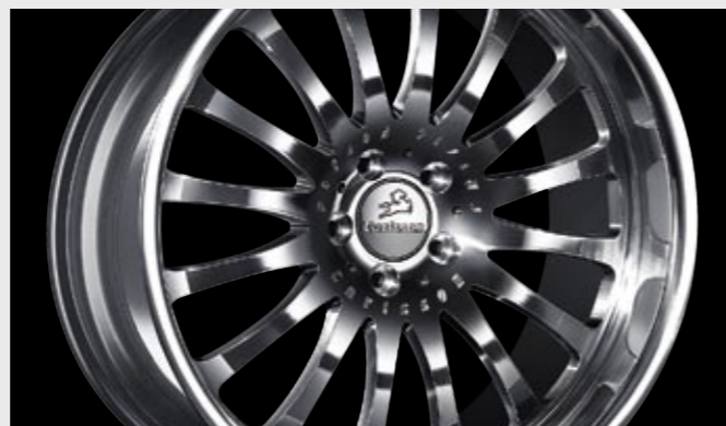
Schmiederad 1/16 Ultra Light (11x20", erhältlich auch in 19") Forged wheel 1/16 Ultra Light (11x20", available in 19" as well)

Compared to casted wheels, forged wheels tend, thanks to their lower weight, to tramp less and thus provide optimum road contact. The result: higher cornering forces, consequently greater safety and, in the last analysis, better ride comfort.