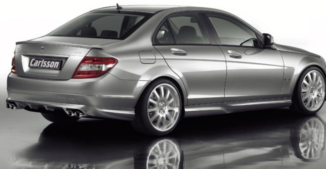
Aluminiumrad 1/11 Brilliant Edition (VA 8,5x19", 225/35 ZR 19 Dunlop SP Sport Maxx – HA 10x19", 255/30 ZR 19 Dunlop SP Sport Maxx) Aluminium wheel 1/11 Brilliant Edition (FA 8.5x19", 225/35 ZR 19 Dunlop SP Sport Maxx – RA 10x19", 255/30 ZR 19 Dunlop SP Sport Maxx)