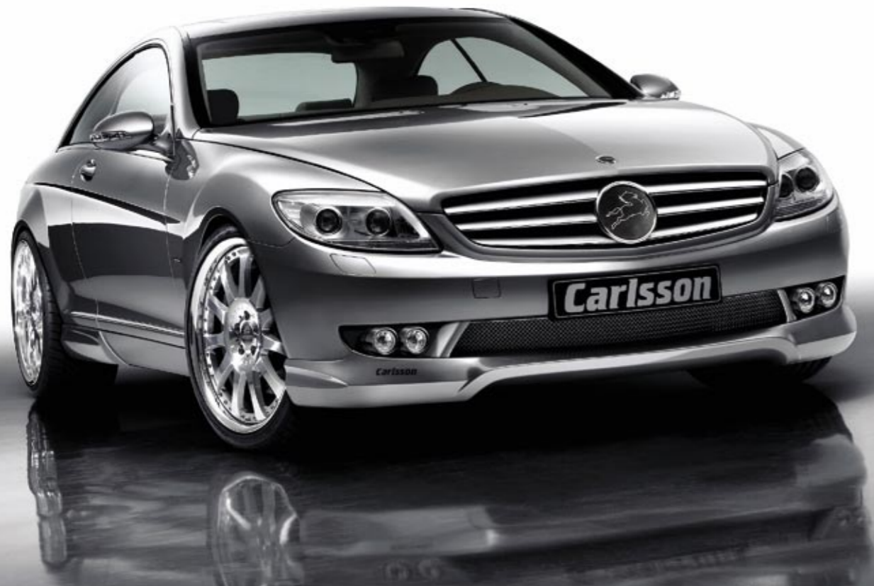
Schmiederad 3/11 Ultra Light (VA 9x21", 255/30 ZR 21, Dunlop SP Sport Maxx – HA 10,5x21", 285/30 ZR 21, Dunlop SP Sport Maxx) Forged wheel 3/11 Ultra Light (FA 9x21", 255/30 ZR 21, Dunlop SP Sport Maxx – RA 10.5x21", 285/30 ZR 21, Dunlop SP Sport Maxx)