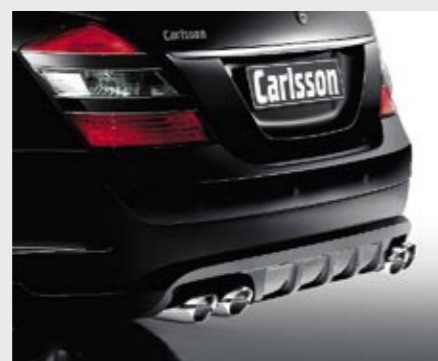
Heckschürzenlippe, Sport-Nachschalldämpfer aus Edelstahl Rear skirt lip, sports rear silencer made of stainless steel