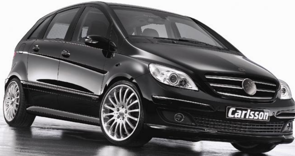
Aluminiumrad 1/16 Brilliant Edition (VA 8,5x19", 225/35 ZR 19 XL Dunlop SP Sport Maxx – HA 8,5x19", 225/35 ZR 19 XL Dunlop SP Sport Maxx, erhältlich auch in 18") Aluminium wheel 1/16 Brilliant Edition (FA 8.5x19", 225/35 ZR 19 XL Dunlop SP Sport Maxx – RA 8.5x19", 225/35 ZR 19 XL Dunlop SP Sport Maxx, available in 18" as well)