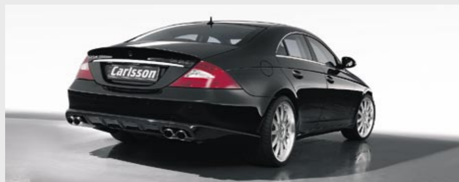
Heckschürzenlippe, Aluminiumrad 1/11 Brilliant Edition (VA 8,5x20" – HA 10,5x20") Rear skirt lip, Aluminium wheel 1/11 Brilliant Edition (FA 8.5x20" – RA 10.5x20")