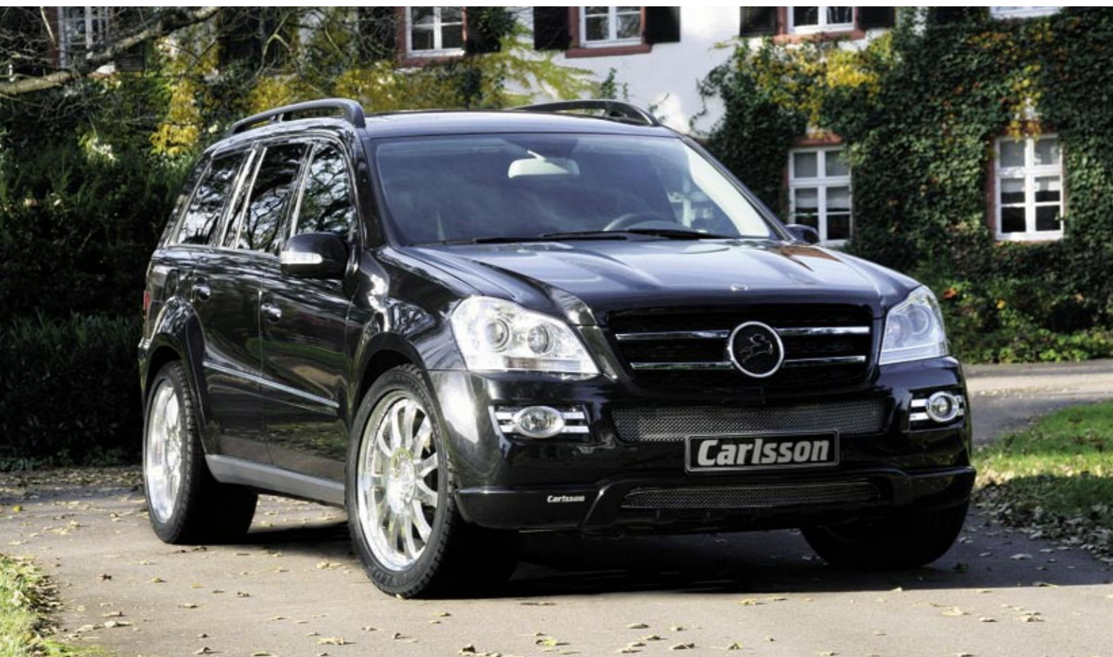
Schmiederad 3/11 Ultra Light (VA 10x22", 305/35 ZR 22 – HA 10x22", 305/35 ZR 22) Forged wheel 3/11 Ultra Light (FA 10x22", 305/35 ZR 22 – RA 10x22", 305/35 ZR 22)