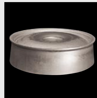
Schmieden 2 Forging 2