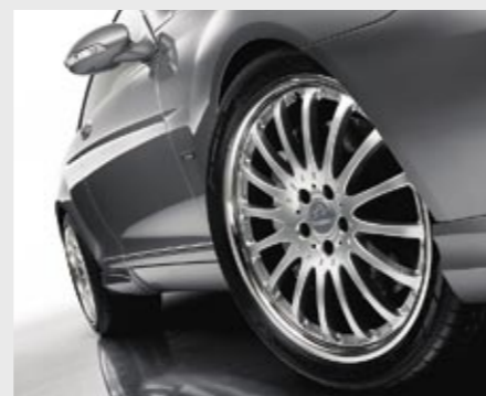
Aluminiumrad 2/16 Brilliant Edition (VA 8,5x20") Aluminium wheel 2/16 Brilliant Edition (FA 8.5x20")