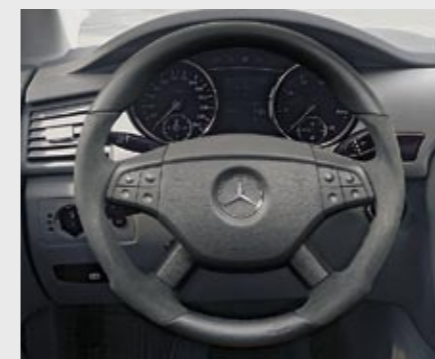
Sport-Lenkrad Leder/Alcantara Sports steering wheel leather/Alcantara