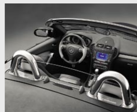
Überrollbügel, Satz in Edelstahl mit Carlsson Logo Safety roll-over bar, stainless steel with Carlsson logo