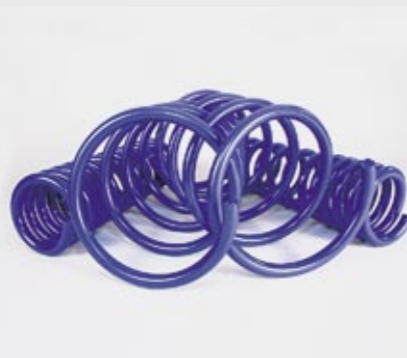
Carlsson Sport-Tieferlegung Carlsson sports lowering kit