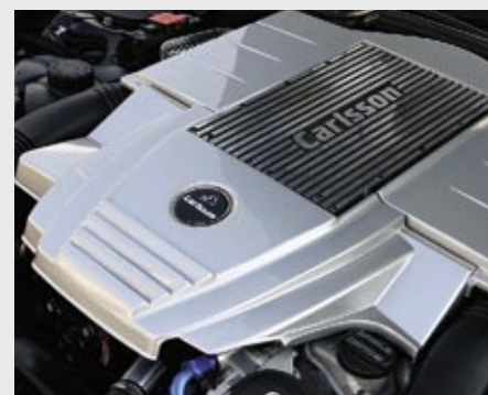
Kompressor-Motor CM55 K, 353 kW (480 PS)/6000 min -1 Compressor engine CM55 K, 353 kW (480 hp)/6000 rpm

A relaxed driving style thanks to large reserves of torque – Carlsson engines tuned for additional power and optimum fuel consumption make it possible. Naturally, you can still enjoy the excellent standard qualities, such as durability and service friendliness. The emissions remain unchanged. Look forward to more pulling power and a high degree of efficiency. Benefit from the active safety and dynamism of Carlsson engines, e.g., when overtaking. With confidence and no compromises.