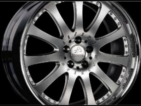
Rad Design 2/11 Brilliant Edition (11x22") Wheel Design 2/11 Brilliant Edition (11x22")