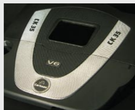
Leistungskit CK35 Performance kit CK35