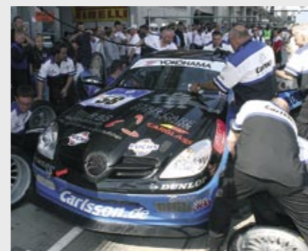
Das Carlsson Racing Team in Aktion The Carlsson Racing Team in action