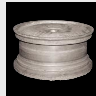
Rotationsschmieden Spin forging