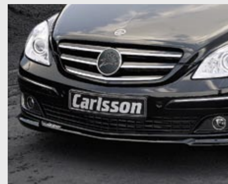
Frontspoilerlippe in Carlsson typischer Optik Front spoiler lip in the company's typical look

With the new B-Class, Mercedes-Benz underscores its role as a trendsetter among the world's leading automobile manufacturers and to attract a young, modern target group that wants functionality combined with fascinating design and a high level of driving pleasure. Thus, this new „compact sports“ touring vehicle represents the ideal platform for Carlsson, the renowned Mercedes tuner, to offer a customised vehicle for B-Class drivers interested in a more ambitious style of driving – a vehicle that stands out from the crowd and combines driving pleasure with a high technological standard.