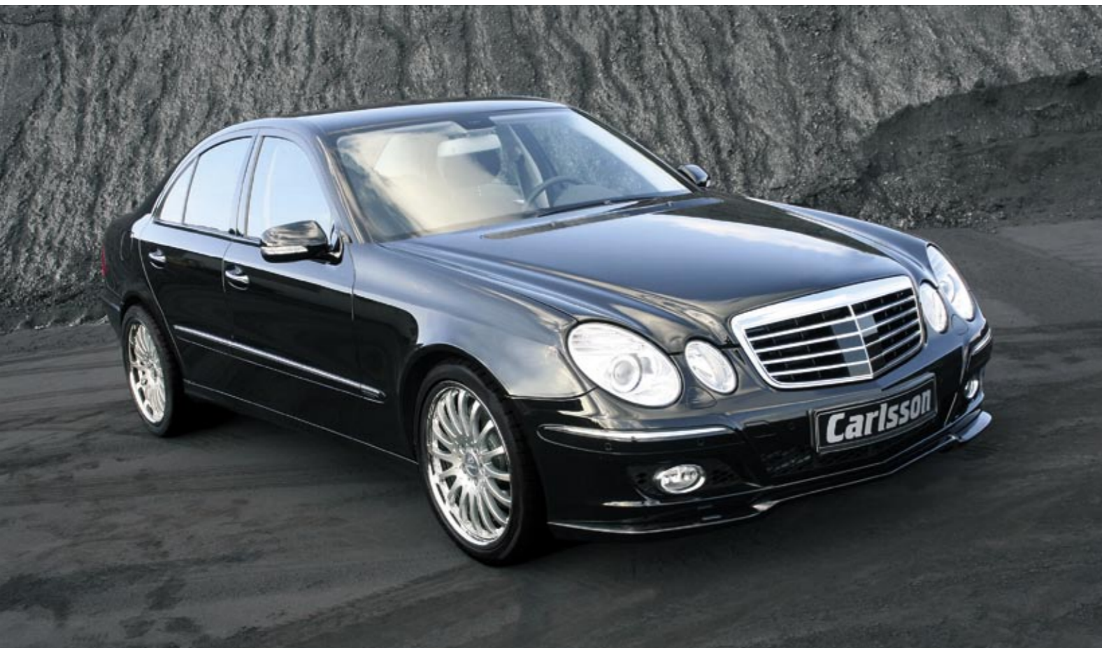
Aluminiumrad 2/16 Brilliant Edition (VA 8,5x19" – HA 10x19") Aluminium wheel 2/16 Brilliant Edition (FA 8.5x19" – RA 10x19")