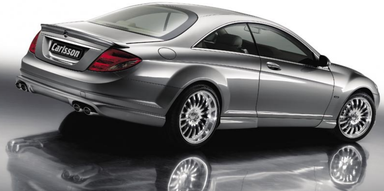
Schmiederad 1/16 Ultra Light (VA 8,5x20", 255/35 ZR 20 Dunlop SP Sport Maxx – HA 11x20", 275/35 ZR 20 Dunlop SP Sport Maxx) Forged wheel 1/16 Ultra Light (FA 8.5x20", 255/35 ZR 20 Dunlop SP Sport Maxx – RA 11x20", 275/35 ZR 20 Dunlop SP Sport Maxx)