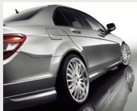
Schmiederad 1/16 Ultra Light (10x19") Forged wheel 1/16 Ultra Light (10x19")

In common with all Carlsson suspension parts, the competition springs are racetrack proven with thousands of race kilometres at the Nürburgring behind them.