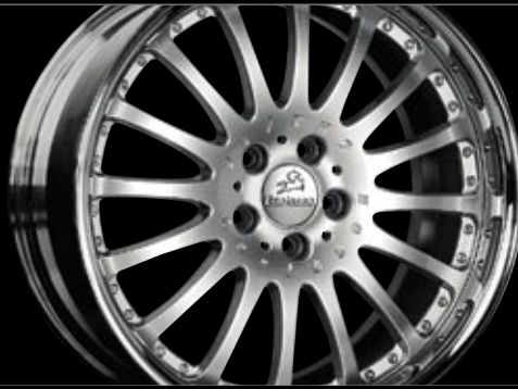
Rad Design 2/16 Brilliant Edition (10,5x20") Wheel Design 2/16 Brilliant Edition (10,5x20")