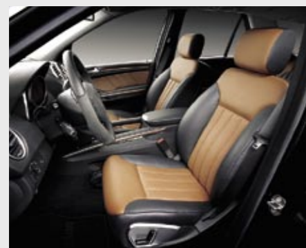
Lederausstattung schwarz/calvados Leather upholstery in black/calvados