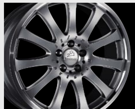
Aluminiumrad 1/11 Brilliant Edition (10,5x20") Aluminium wheel 1/11 Brilliant Edition (10.5x20")