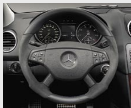
Sport-Lenkrad Leder/Alcantara Sports steering wheel leather/Alcantara