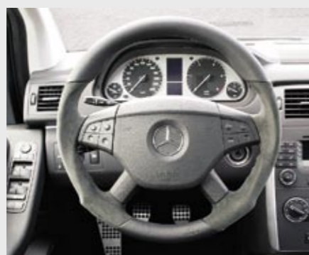
Sport-Lenkrad Leder/Alcantara Sports steering wheel leather/Alcantara