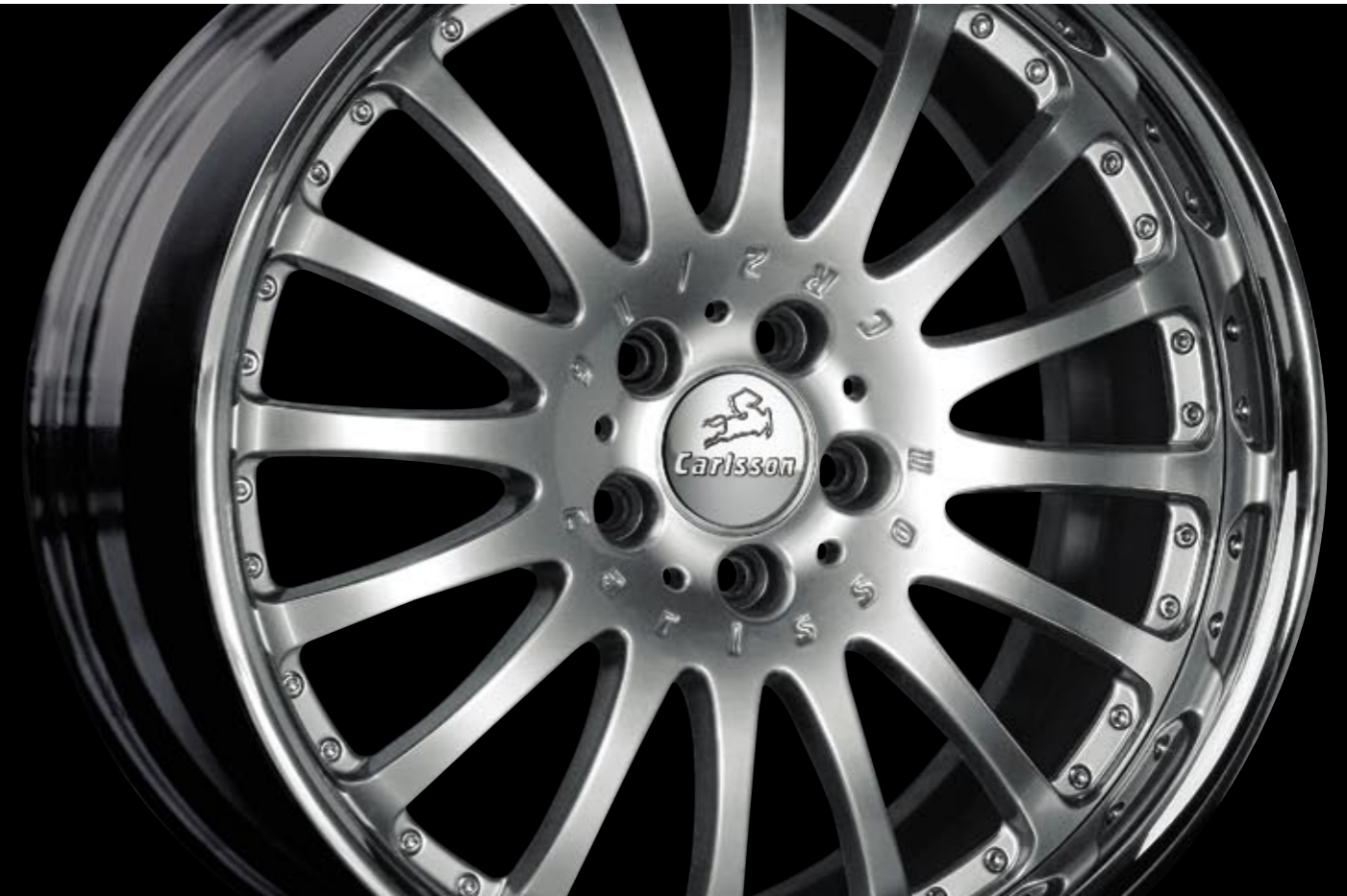
Aluminiumrad 2/16 Brilliant Edition (erhältlich in 19" und 20") Aluminium wheel 2/16 Brilliant Edition (available in 19" and 20")