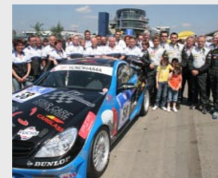
Das Team beim 24h-Rennen am Nürburgring The team at the 24 Hour Race at the Nürburgring