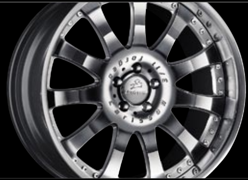
Rad Design 3/11 Ultra Light (10,5x21") Wheel Design 3/11 Ultra Light (10,5x21")