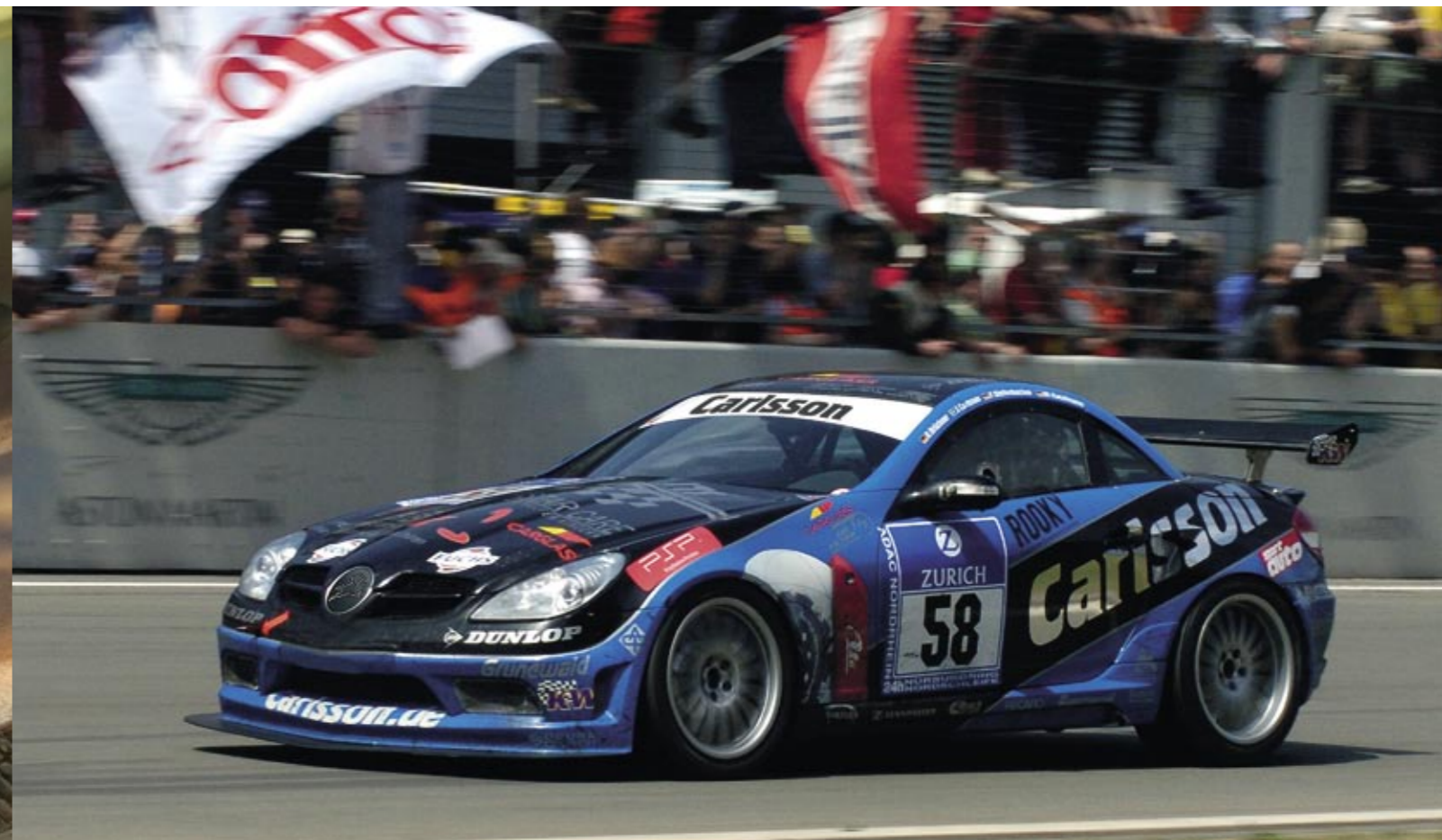
Nach 24 Stunden am Ziel ... Finished after 24 hours ...