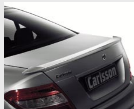
Carlsson Heckspoiler in Polyurethan Carlsson rear spoiler made of polyurethan