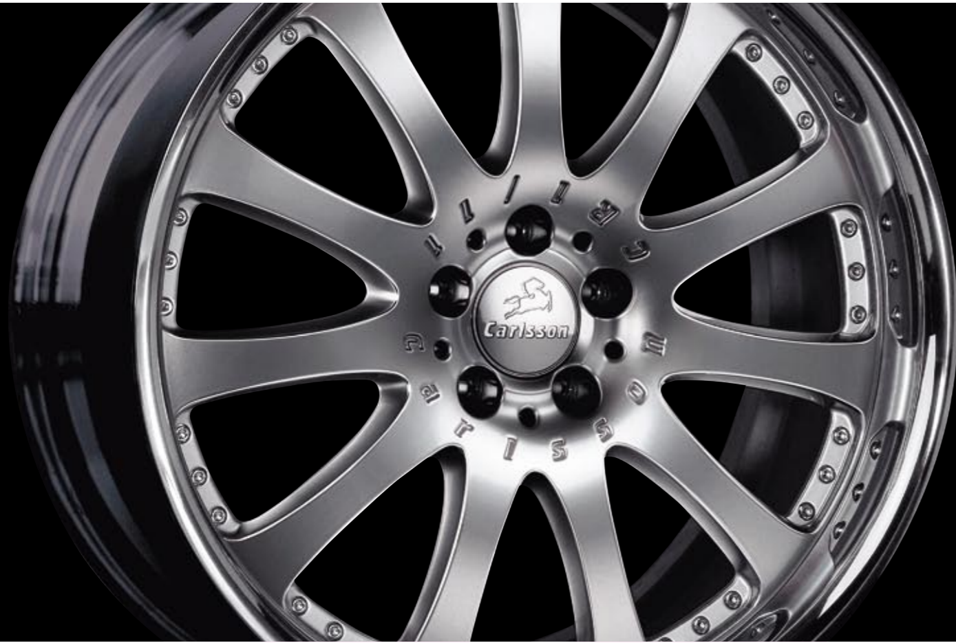
Aluminiumrad 2/11 Brilliant Edition (erhältlich in 22") Aluminium wheel 2/11 Brilliant Edition (available in 22")