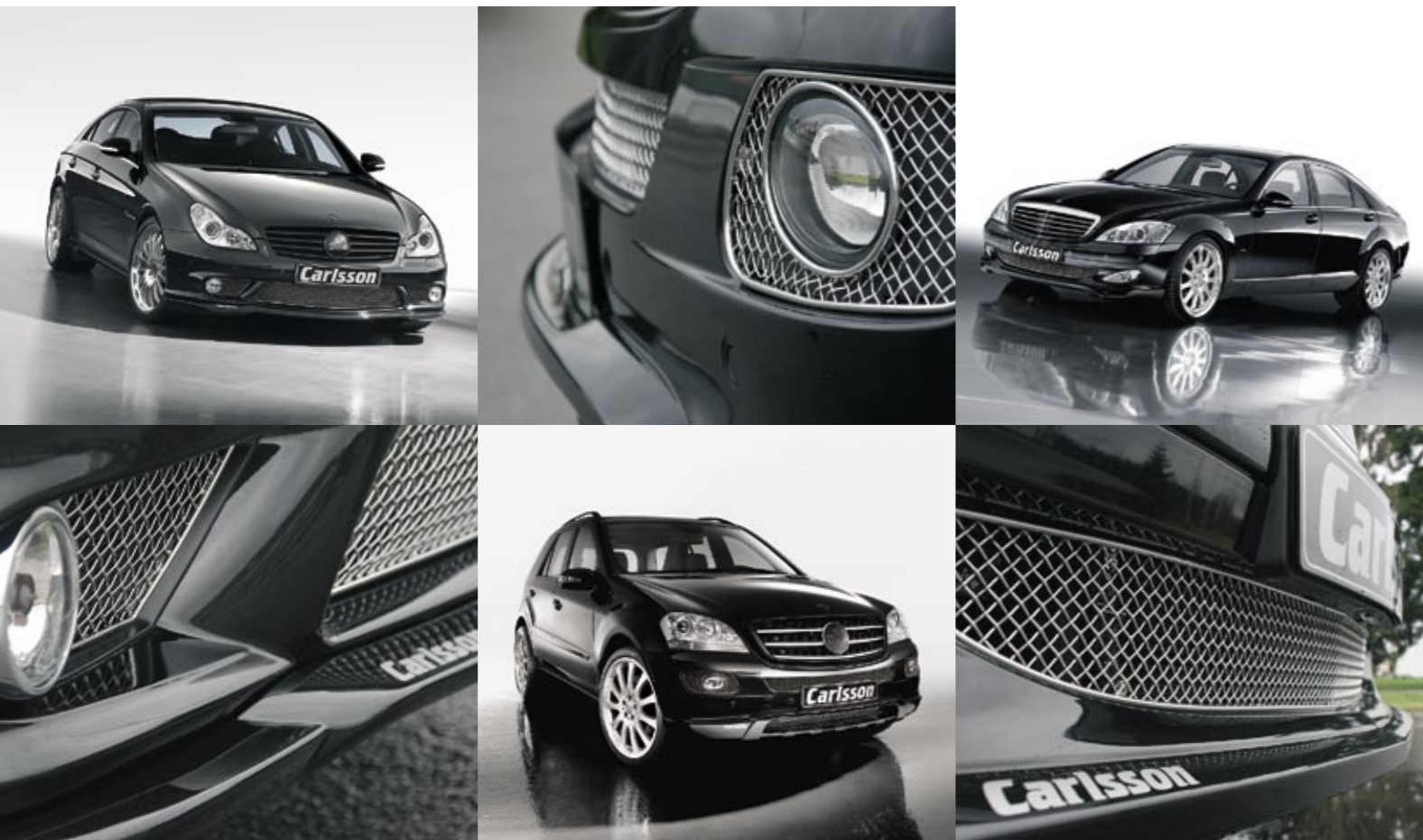
1. Reihe: Basis CLS 55 AMG, Grilleinsatz für M-Klasse W 164, Basis S-Klasse W 221 – 2. Reihe: Grilleinsatz für CLS 55 AMG, Basis M-Klasse W 164, Grilleinsatz für S-Klasse W 221 1 st row: based on the CLS 55 AMG, grill inlet for M-Class W 164, based on the S-Class W 221 – 2 nd row: grill inlet for CLS 55 AMG, based on the M-Class W 164, grill inlet for S-Class W 221

WIR SIND IMMER FÜR SIE DA! WE ARE ALWAYS AT YOUR SERVICE!