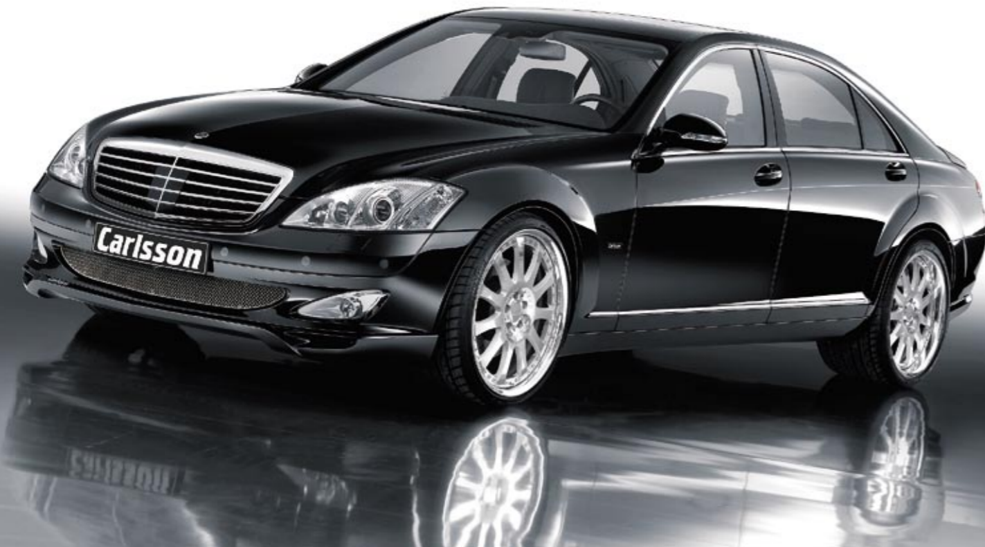
Schmiederad 3/11 Ultra Light (VA 9x21", 255/30 ZR 21 Dunlop SP Sport Maxx – HA 10,5x21", 285/30 ZR 21 Dunlop SP Sport Maxx) Forged wheel 3/11 Ultra Light (FA 9x21", 255/30 ZR 21 Dunlop SP Sport Maxx – RA 10,5x21", 285/30 ZR 21 Dunlop SP Sport Maxx)