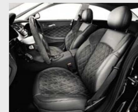
Lederausstattung Alcantara anthrazit, Raute gesteppt Leather upholstery, Alcantara, anthracite with rhombus quilting