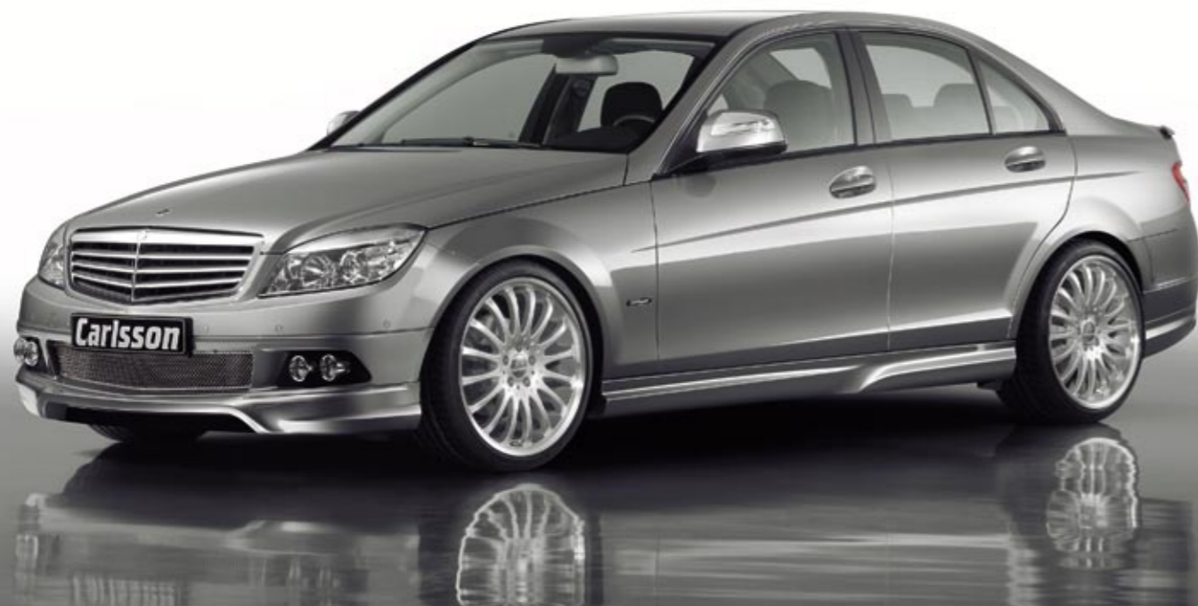
Aluminiumrad 1/16 Brilliant Edition (VA 8,5x19", 225/35 ZR 19 Dunlop SP Sport Maxx – HA 10x19", 255/30 ZR 19 Dunlop SP Sport Maxx) Aluminium wheel 1/16 Brilliant Edition (FA 8.5x19", 225/35 ZR 19 Dunlop SP Sport Maxx – RA 10x19", 255/30 ZR 19 Dunlop SP Sport Maxx)