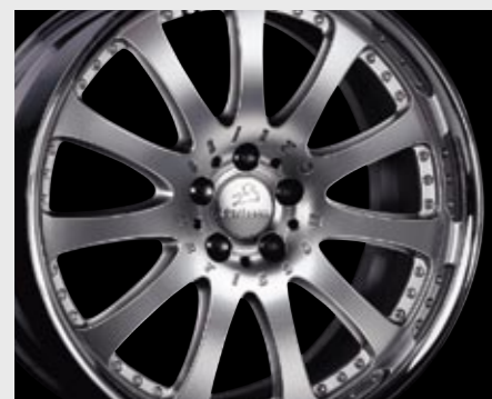
Aluminiumrad 2/11 Brilliant Edition (11x22") Aluminium wheel 2/11 Brilliant Edition (11x22")