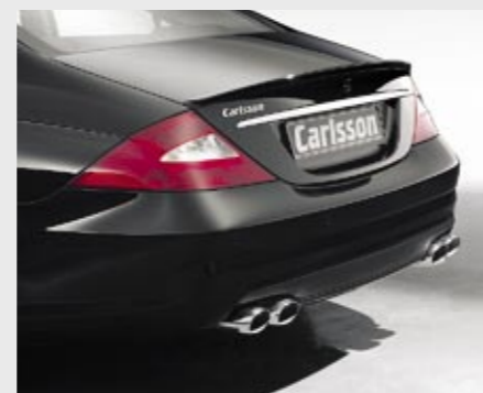
Sport-Nachschalldämpfer, Edelstahl, 2-teilig, 4-Rohr Endblende Sports rear silencer, stainless steel, 2 pieces, 4 oval tailpipes