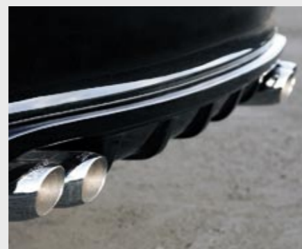
Heckschürzenlippe, Sport-Nachschalldämpfer, Edelstahl Rear skirt lip, sports rear silencer, stainless steel