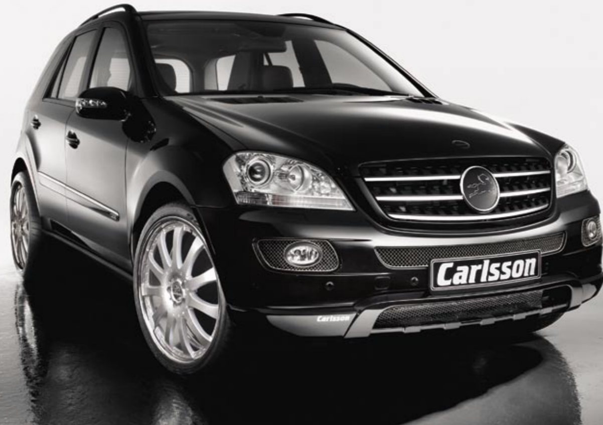
Aluminiumrad 2/11 Brilliant Edition (VA 10x22", 285/30 ZR 20 Dunlop SP 9000 – HA 10x22", 285/30 ZR 20 Dunlop SP 9000) Aluminium wheel 2/11 Brilliant Edition (FA 10x22", 285/30 ZR 22 Dunlop SP 9000 – RA 10x22", 285/30 ZR 22 Dunlop SP 9000)