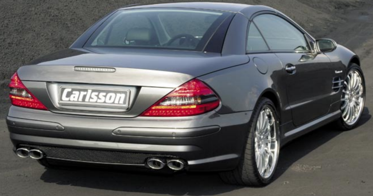
Aluminiumrad 2/16 Brilliant Edition (VA 8,5x20", 255/30 ZR 20 XL Dunlop SP Sport Maxx – HA 10,5x20", 305/25 ZR 20 XL Dunlop SP Sport Maxx, erhältlich auch in 19") Aluminium wheel 2/16 Brilliant Edition (FA 8.5x20", 255/30 ZR 20 XL Dunlop SP Sport Maxx – RA 10.5x20", 305/25 ZR 20 XL Dunlop SP Sport Maxx, available in 19" as well)