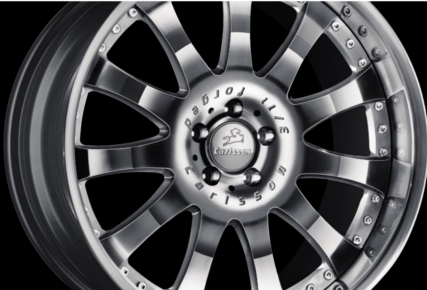
Schmiederad 3/11 Ultra Light (erhältlich in 21", 22" und 23") Forged wheel 3/11 Ultra Light (available in 21", 22" and 23")