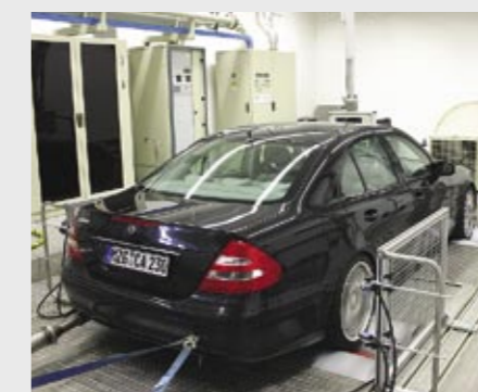
Die C-Tronic® Diesel ECO im TÜV-Test = Kraftstoffersparnis! The C-Tronic® Diesel ECO at the TÜV test = fuel saving!