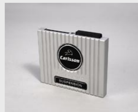
C-Tronic® SUSPENSION – elektronische Tieferlegung C-Tronic® SUSPENSION – electronic lowering system