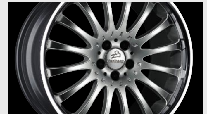
Aluminiumrad 1/16 Brilliant Edition (10x19", erhältlich auch in 18") Aluminium wheel 1/16 Brilliant Edition (10x19", available in 18" as well)

Exclusive wheels from Carlsson convince by their optical characteristic and their high quality machining. Quite unique and luxurious: the lavish wheels of the Brilliant Edition series. In the Mercedes-Benz tuning sector this combination of two different surface finishes can only be found exclusively at Carlsson.