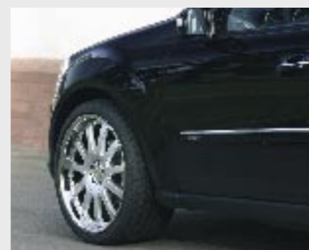
Aluminiumrad 2/11 Brilliant Edition (VA 11x22"/HA 11x22") Aluminium Wheel 2/11 Brilliant Edition (FA 10x22"/RA 10x22")