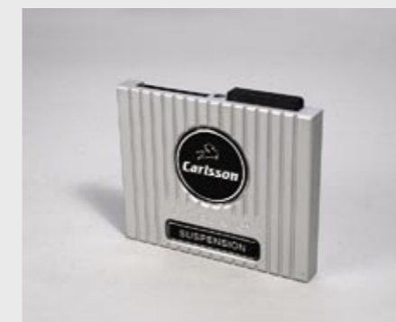
C-Tronic® SUSPENSION – elektronische Tieferlegung C-Tronic® SUSPENSION – electronic lowering system