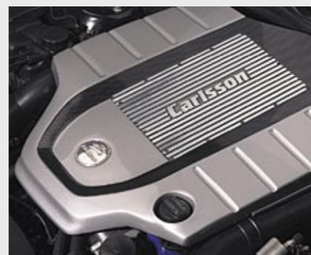
Kompressor-Motor CM50 K, 316 kW (430 PS)/6000 min -1 Compressor engine CM50 K, 316 kW (430 hp)/6000 rpm