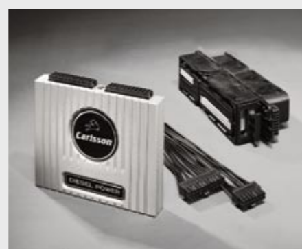
Leistungsakit C-Tronic® Diesel POWER CD32 Performance kit C-Tronic® Diesel POWER CD32