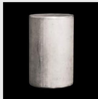
Strangepresster Rohling Extruded blank