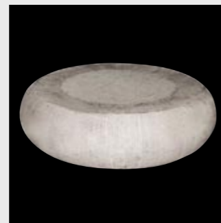
Schmieden 1 Forging 1