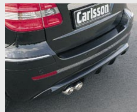
Heckschürzenlippe in Carlsson typischer Optik Rear skirt lip in typical Carlsson look