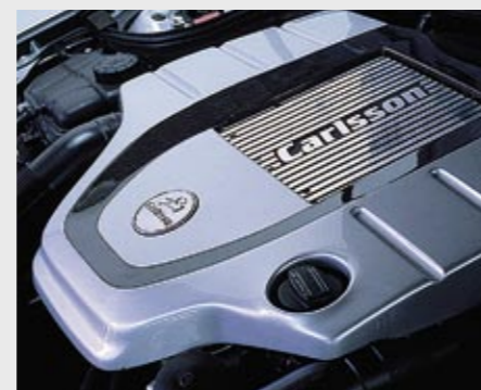
Kompressor-Motor CM35 K, 243 kW (330 PS)/5900 min -1 Compressor engine CM35 K, 243 kW (330 hp)/5900 rpm