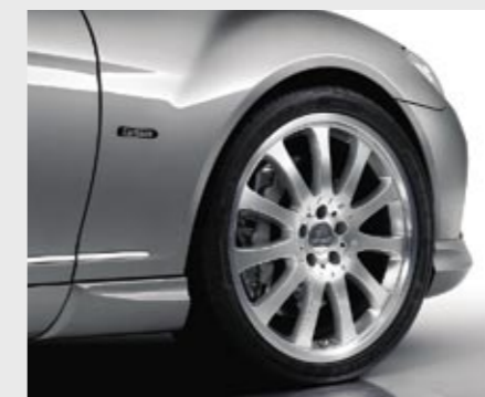
Aluminiumrad 1/11 Brilliant Edition (VA 8,5x20") Aluminium wheel 1/11 Brilliant Edition (VA 8.5x20")