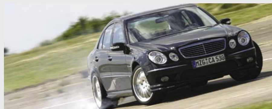
177 kW (240 PS)/4000 min -1 , max. Drehmoment 580 Nm/2000 min -1 mit der C-Tronic® Diesel POWER CD32, Basis E 320 CDI 177 kW (240 hp)/4000 rpm, max. torque 580 Nm/2000 rpm with the C-Tronic® Diesel POWER CD32 based on the E 320 CDI

Exclusive to Carlsson is the electronic C-Tronic® SUSPENSION lowering system that not only lowers the vehicle's centre of gravity by up to 30 mm but also, thanks to its sophisticated electronics, interacts intelligently with changing road surfaces. On bumpy roads that continuously cause the springs to compress significantly, the vehicle height is automatically raised to ensure sufficient suspension travel for constant ride comfort. Moreover, the system ensures that, when travelling at speeds of over 120 km/h, the car is not lowered any further, as would be the case with the standard model. Therefore, the minimum vehicle height is always maintained.