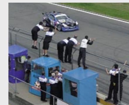
Siegreicher Endsprint des CK35 RS (Basis SLK 350) Triumphal final sprint by the CK35 RS (based on the SLK 350)