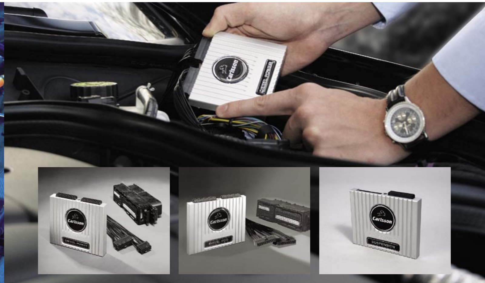
Zeitsparender und einfacher Einbau der C-Tronic® Leistungskits Quick and easy installation of the C-Tronic® performance kits