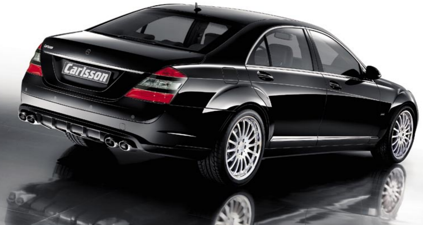
Aluminiumrad 2/16 Brilliant Edition (VA 8,5x20", 255/35 ZR 20 XL Dunlop SP Sport Maxx – HA 10,5x20", 275/35 ZR 20 XL Dunlop SP Sport Maxx) Aluminium wheel 2/16 Brilliant Edition (FA 8,5x20", 255/35 ZR 20 XL Dunlop SP Sport Maxx – RA 10,5x20", 275/35 ZR 20 XL Dunlop SP Sport Maxx)