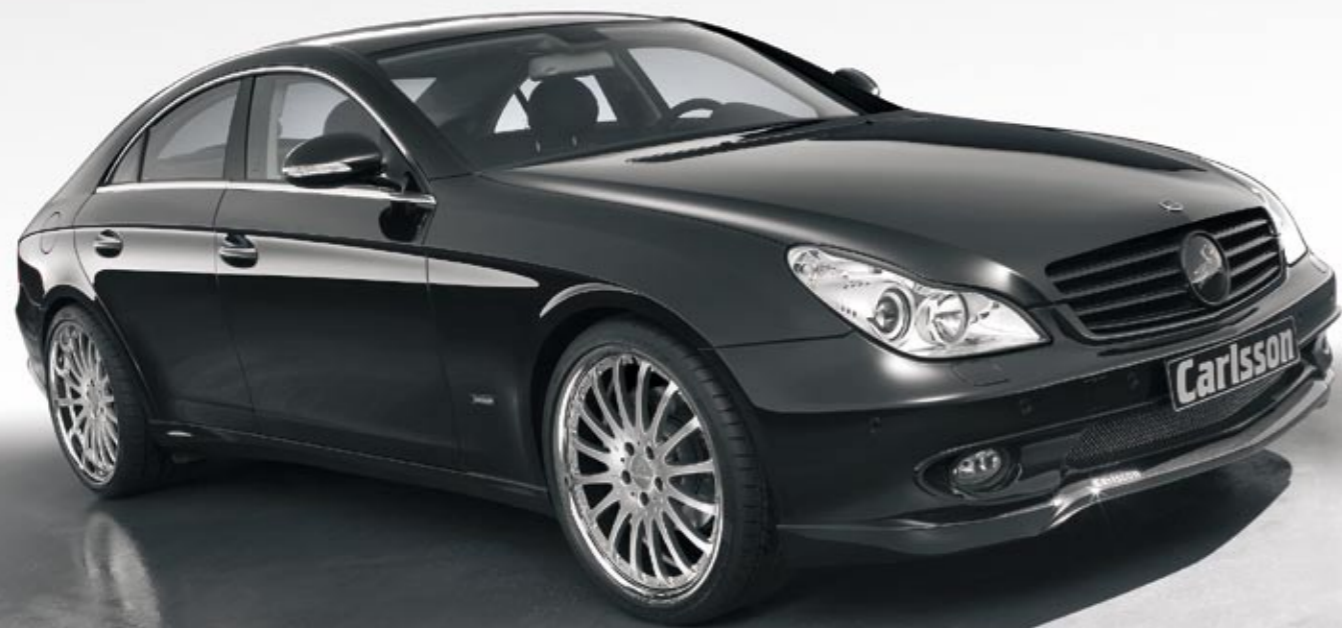
Aluminiumrad 2/16 Brilliant Edition (VA 8,5x20", 255/30 ZR 20 XL Dunlop SP Sport Maxx – HA 10,5x20", 305/25 ZR 20 XL Dunlop SP Sport Maxx, erhältlich auch in 19") Aluminium wheel 2/16 Brilliant Edition (FA 8.5x20", 255/30 ZR 20 XL Dunlop SP Sport Maxx – RA 10.5x20", 305/25 ZR 20 XL Dunlop SP Sport Maxx, available in 19" as well)