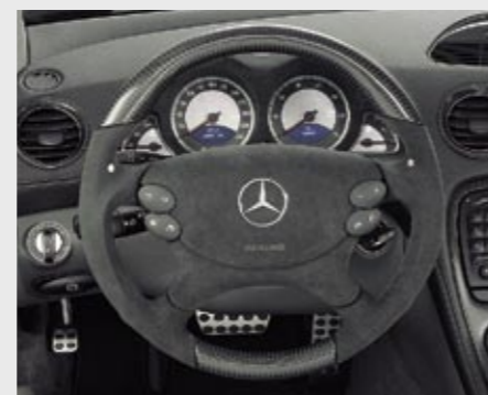
Sport-Lenkrad Carbon/Alcantara Sports steering wheel carbon/Alcantara