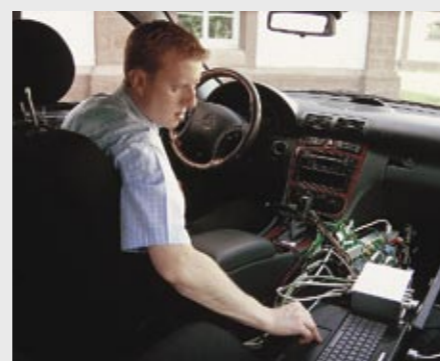
Hausinterne Entwicklung und Erprobung In-house development and testing