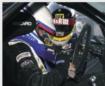
Fahrerwechsel während des 24h-Rennens am Nürburgring Driver change during the 24 Hour Race at the Nürburgring