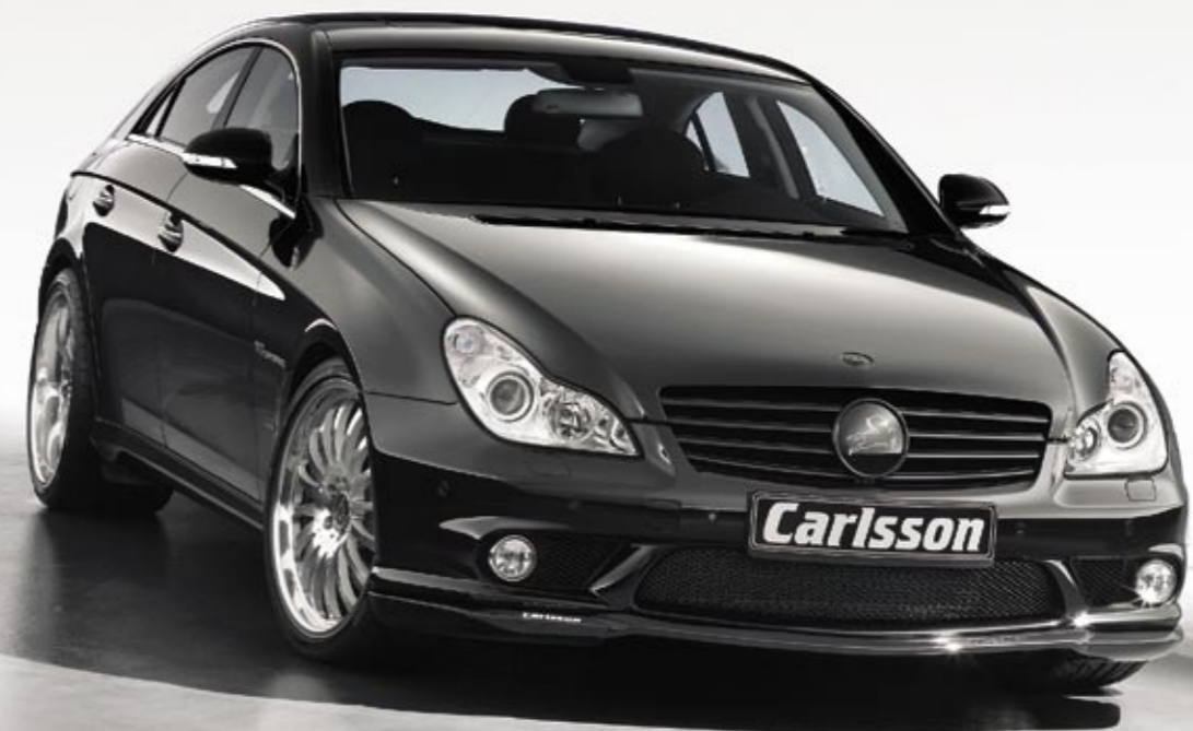
Schmiederad 1/16 Ultra Light (VA 8,5x20", 255/30 ZR 20 Dunlop SP Sport Maxx – HA 11x20", 305/25 ZR 20 Dunlop SP Sport Maxx, erhältlich auch in 19") Forged wheel 1/16 Ultra Light (FA 8.5x20", 255/30 ZR 20 Dunlop SP Sport Maxx – RA 11x20", 305/25 ZR 20 Dunlop SP Sport Maxx, available in 19" as well)