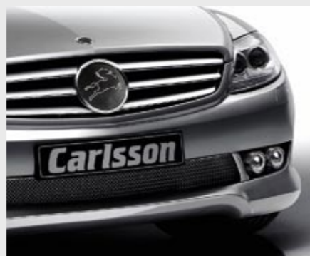
Frontspoilerlippe in Carlsson typischer Optik Front spoiler lip in the company's typical look