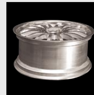
Drehbearbeitung, Fräsbearbeitung Turning, Milling