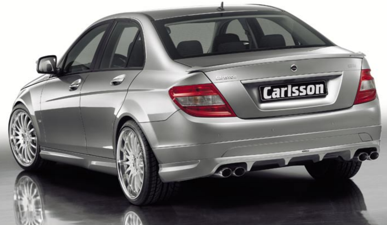
Aluminiumrad 1/16 Brilliant Edition (VA 8,5x19", 225/35 ZR 19 Dunlop SP Sport Maxx – HA 10x19", 255/30 ZR 19 Dunlop SP Sport Maxx) Aluminium wheel 1/16 Brilliant Edition (FA 8.5x19", 225/35 ZR 19 Dunlop SP Sport Maxx – RA 10x19", 255/30 ZR 19 Dunlop SP Sport Maxx)