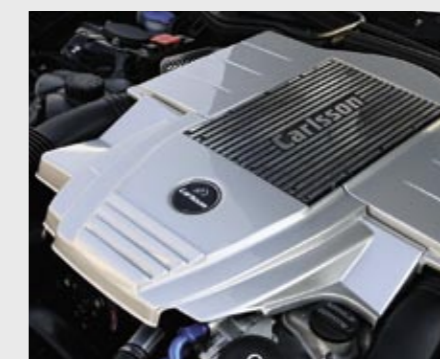
Kompressor Motor CM55 K, Basis SLK 55 AMG Compressor engine CM55 K, based on the SLK 55 AMG