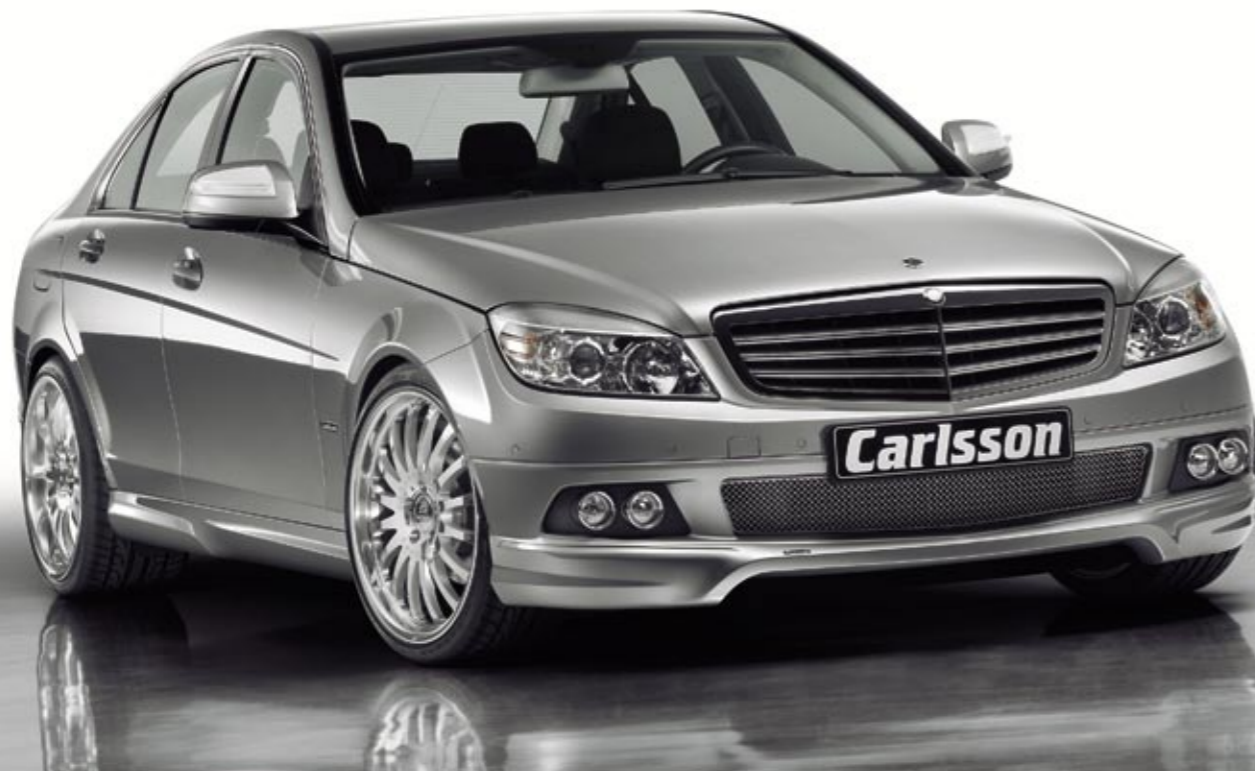
Schmiederad 1/16 Ultra Light (VA 8,5x19", 225/35 ZR 19 Dunlop SP Sport Maxx – HA 10x19", 265/30 ZR 19 Dunlop SP Sport Maxx) Forged wheel 1/16 Ultra Light (FA 8.5x19", 225/35 ZR 19 Dunlop SP Sport Maxx – RA 10x19", 255/30 ZR 19 Dunlop SP Sport Maxx)