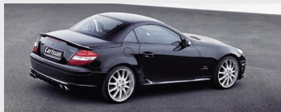
Aluminiumrad 1/11 Brilliant Edition (VA 8,5x19" – HA 10x19") Aluminium wheel 1/11 Brilliant Edition (VA 8.5x19" – HA 10x19")