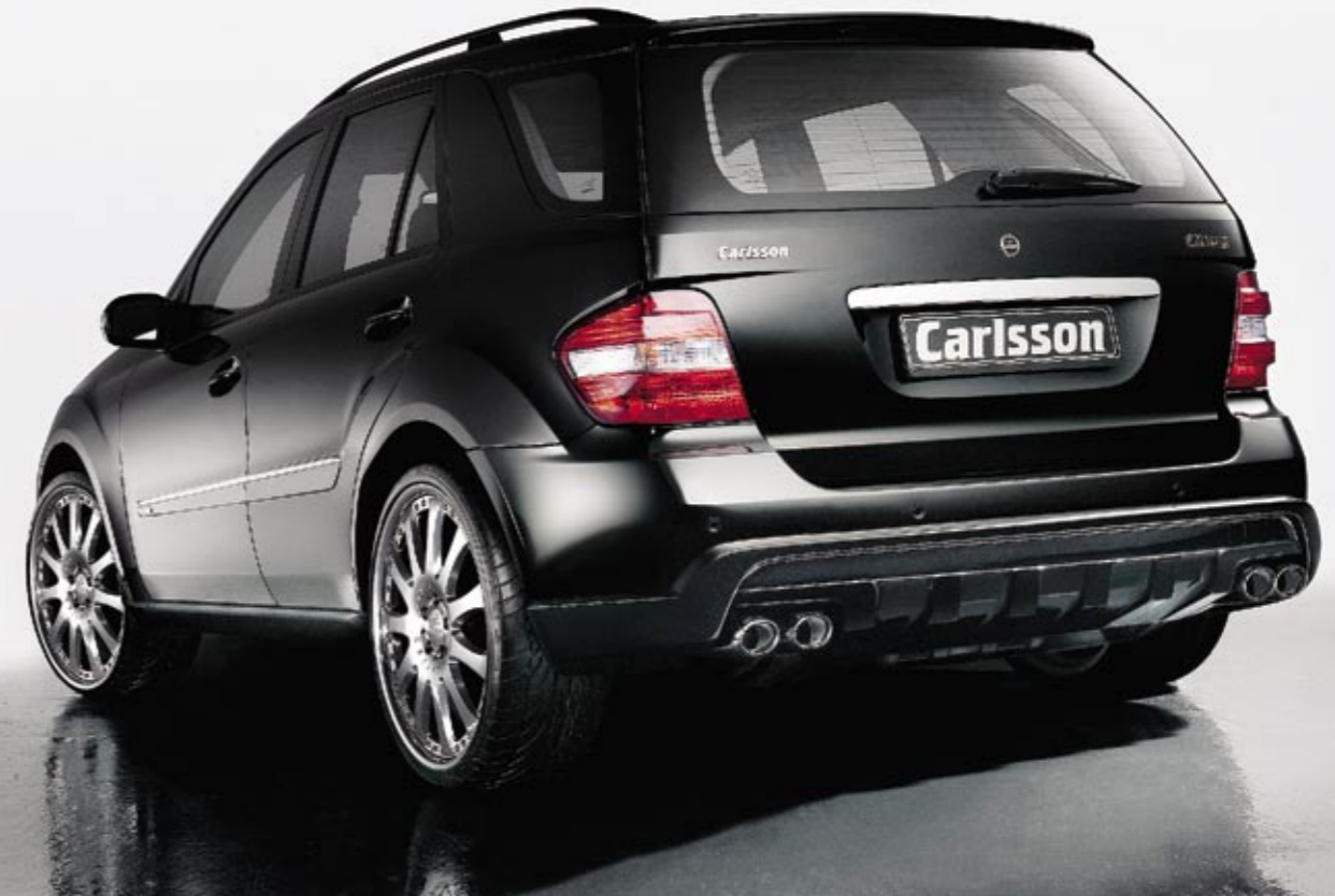
Schmiederad 3/11 Ultra Light (VA 11x23", 315/25 ZR 23 – HA 11x23", 315/25 ZR 23, erhältlich auch in 21" und 22") Forged wheel 3/11 Ultra Light (FA 11x23", 315/25 ZR 23 – RA 11x23", 315/25 ZR 23, available in 21" and 22" as well)