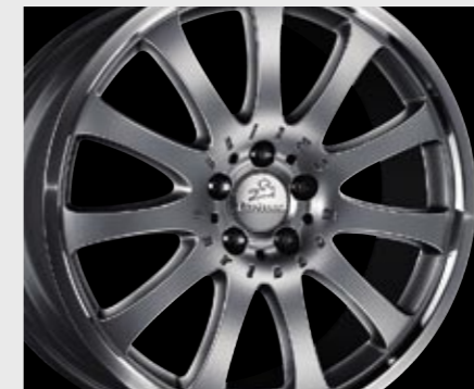
Aluminiumrad 1/11 Brilliant Edition (8x18") Aluminium wheel 1/11 Brilliant Edition (8x18")