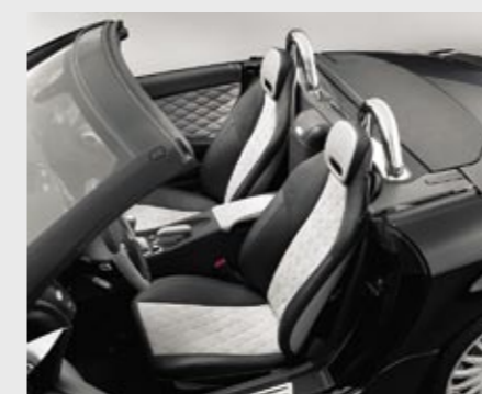
Lederausstattung Alcantara platingrau/anthrazit Leather/Alcantara upholstery in platinum grey/anthracite