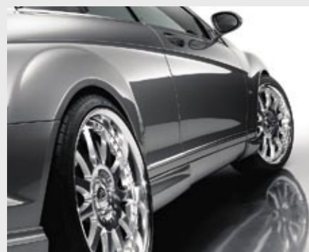
Schmiederad 3/11 Ultra Light (VA 9x21"/HA 10,5x21") Forged wheel 3/11 Ultra Light (FA 9x21"/RA 10.5x21")