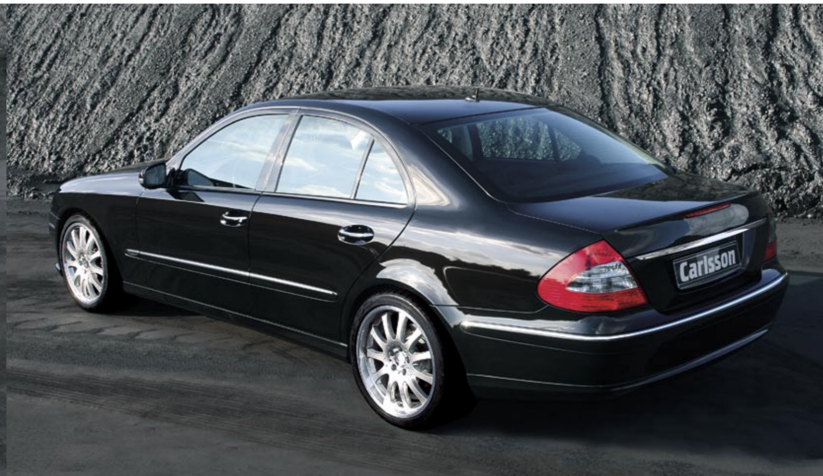
Aluminiumrad 1/11 Brilliant Edition (VA 8,5x19" – HA 10x19") Aluminium wheel 1/11 Brilliant Edition (FA 8.5x19" – RA 10x19")