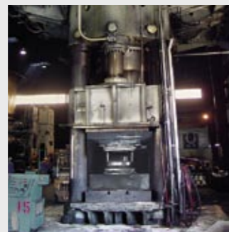
Schmiedepresse 5000 Tonnen 5000 tonne forging press