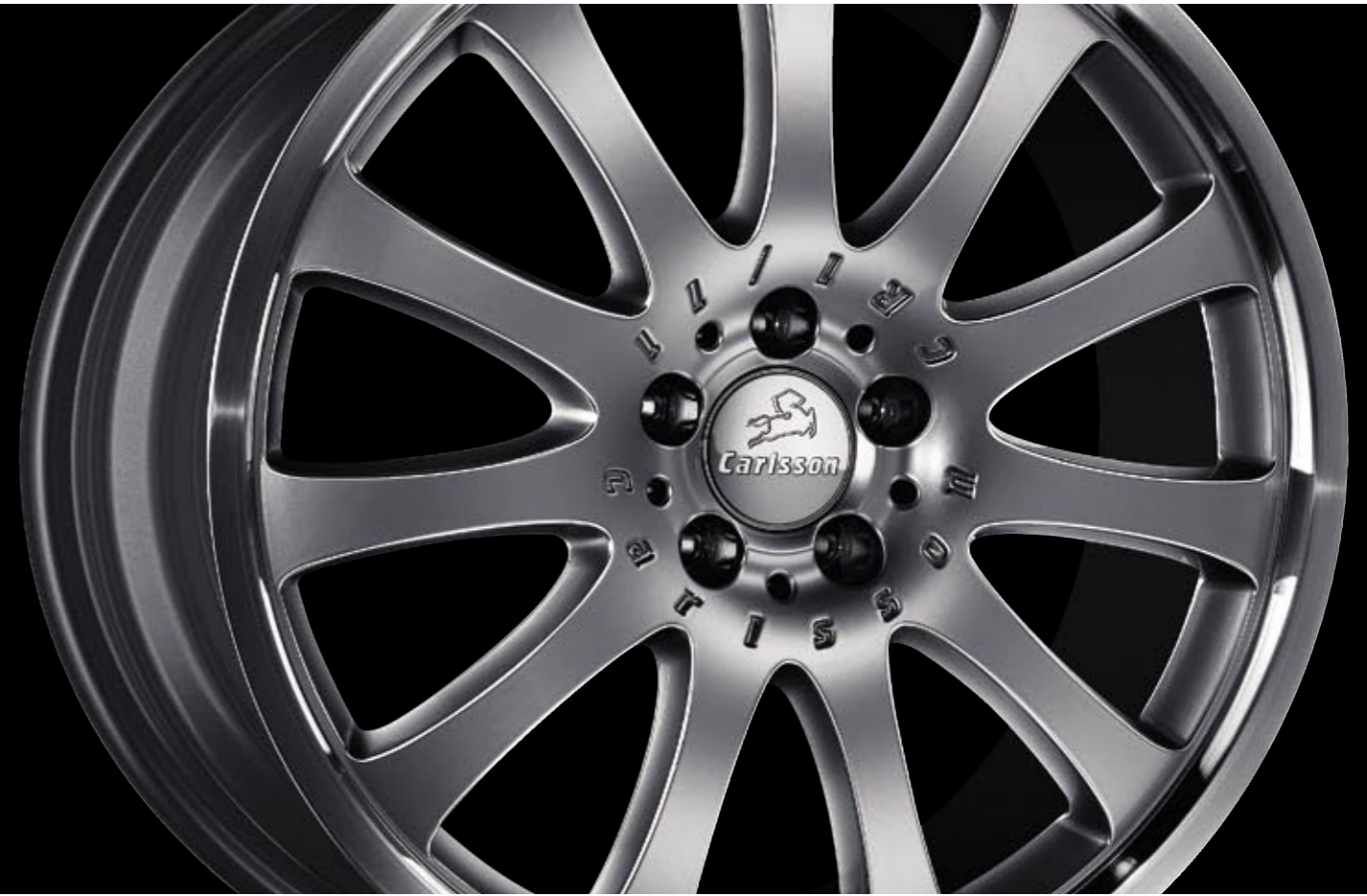
Aluminiumrad 1/11 Brilliant Edition (erhältlich in 19" und 20") Aluminium wheel 1/11 Brilliant Edition (available in 19" and 20")