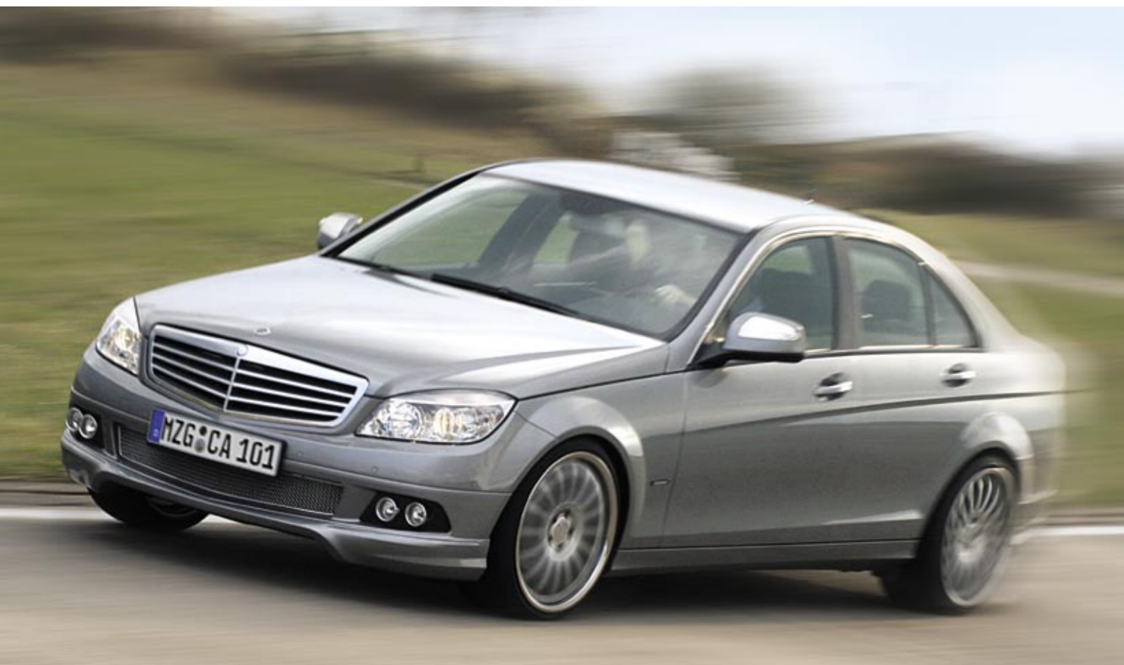
Die C-Tronic® Produktfamilie – Garant für pures Fahrvergnügen! The C-Tronic® product range – The guarantee of pure driving pleasure!