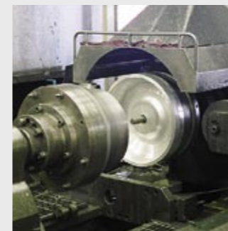
Rotationsschmiedemaschine Spin forging machine