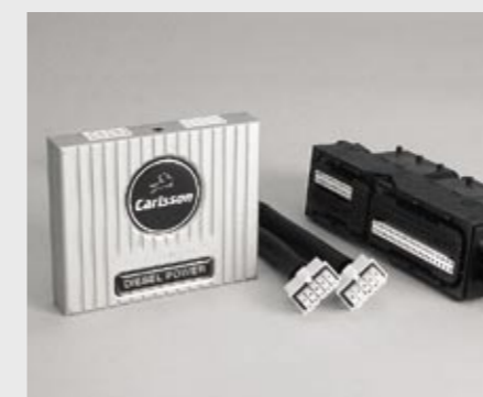
C-Tronic® Diesel POWER für A-, B-, M- und R-Klasse C-Tronic® Diesel POWER for A-, B-, M- und R-Class

The Carlsson customer service is your contact partner for all technical questions and warranty issues. Our qualified service team is pleased to provide you with important information and to assist you in warranty issues.