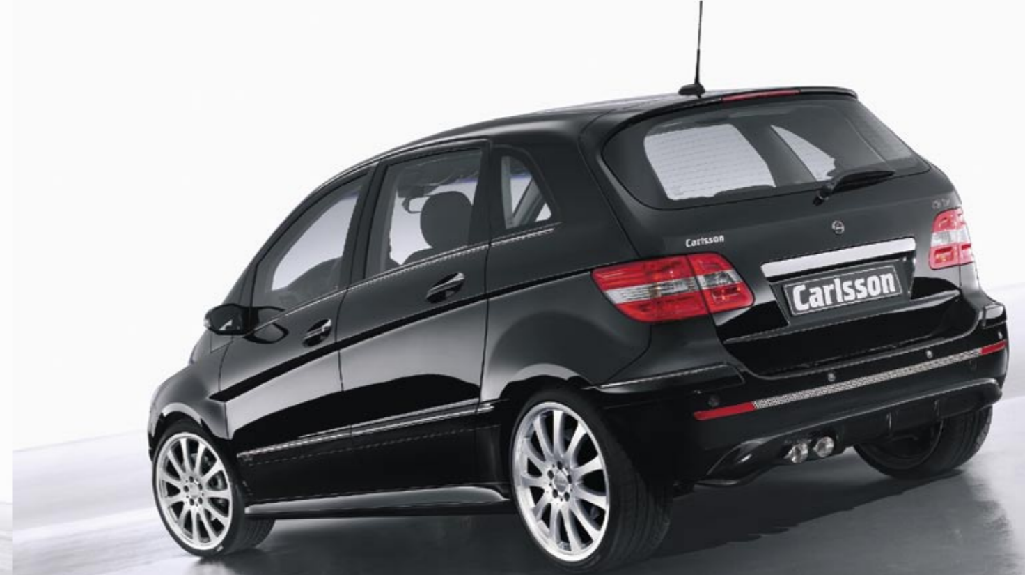
Aluminiumrad 1/11 Brilliant Edition (VA 8,5x19", 225/35 ZR 19 Dunlop SP Sport Maxx – HA 8,5x19", 225/35 ZR 19 Dunlop SP Sport Maxx, erhältlich auch in 18") Aluminium wheel 1/11 Brilliant Edition (FA 8.5x19", 225/35 ZR 19 Dunlop SP Sport Maxx – RA 8.5x19", 225/35 ZR 19 Dunlop SP Sport Maxx, available in 18" as well)