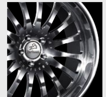
Polieren, Lackieren, fertiges Rad 1/16 UL Polishing, Painting, The finished 1/16 UL