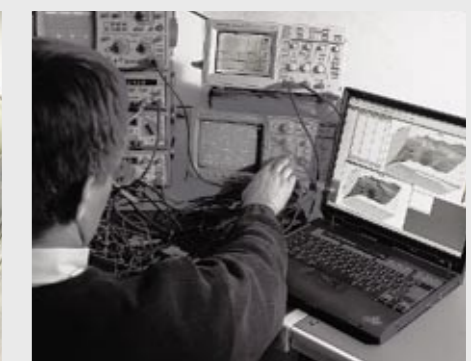
Ingenieur bei der Basisapplikation der Sicherheitsfunktion Engineer working on the basic application of safety functions