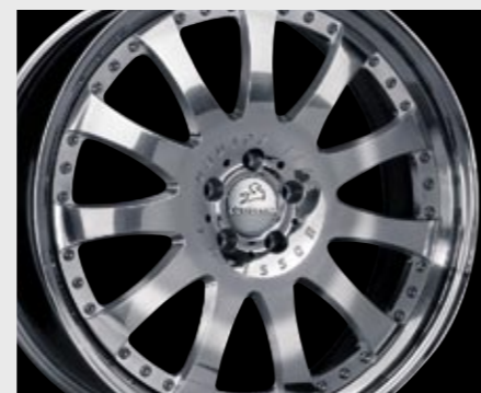
Aluminiumrad 3/11 Ultra Light (11x22") Aluminium wheel 3/11 Ultra Light (11x22")