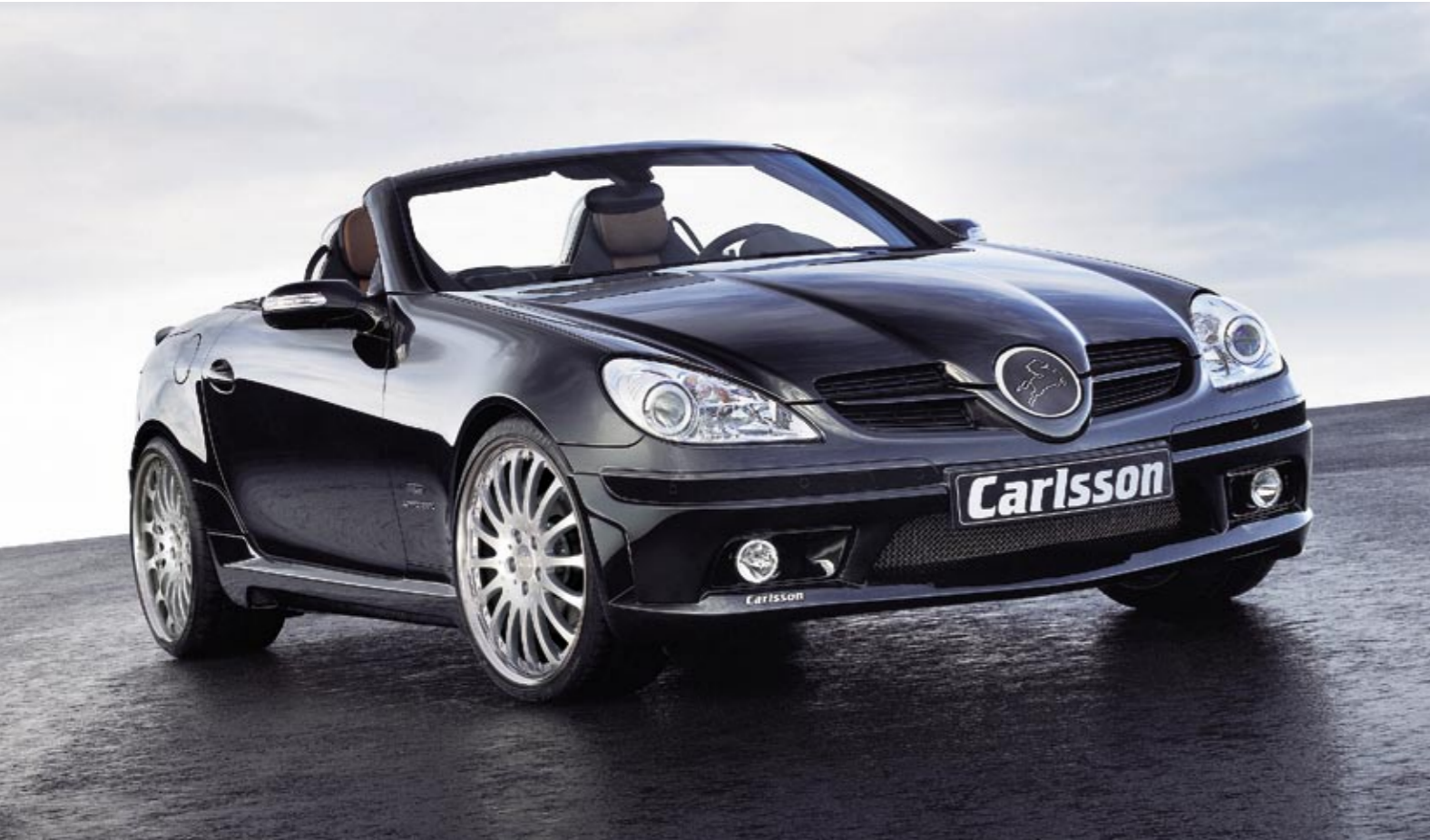
Aluminiumrad 2/16 Brilliant Edition (VA 8,5x19", 225/35 ZR 19 XL Dunlop SP Sport Maxx – HA 10x19", 255/30 ZR 19 XL Dunlop SP Sport Maxx) Aluminium wheel 1/16 Brilliant Edition (FA 8.5x19", 225/35 ZR 19 XL Dunlop SP Sport Maxx – RA 10x19", 255/30 ZR 19 XL Dunlop SP Sport Maxx)