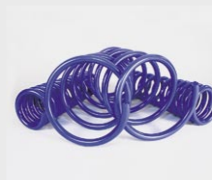
Carlsson Sport-Tieferlegung Carlsson sports lowering kit