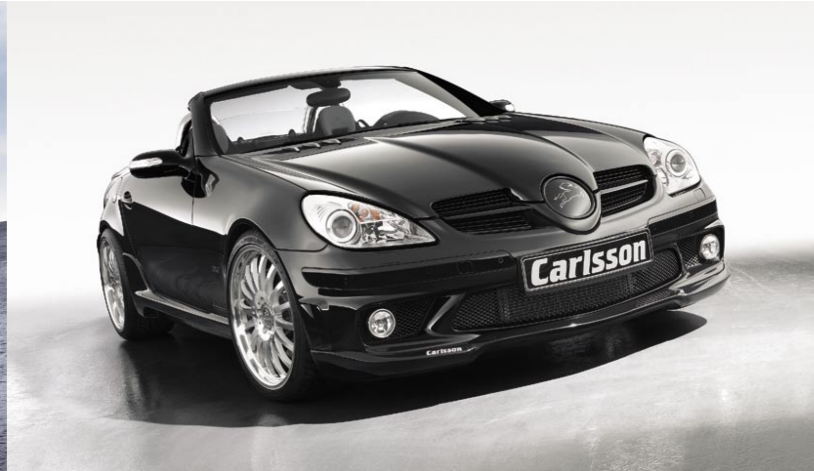
Schmiederad 1/16 Ultra Light (VA 8,5x19", 235/35 ZR 19 Dunlop SP Sport Maxx – HA 10x19", 265/30 ZR 19 Dunlop SP Sport Maxx) Forged wheel 1/16 Ultra Light (FA 8.5x19", 235/35 ZR 19 Dunlop SP Sport Maxx – RA 10x19", 265/30 ZR 19 Dunlop SP Sport Maxx)