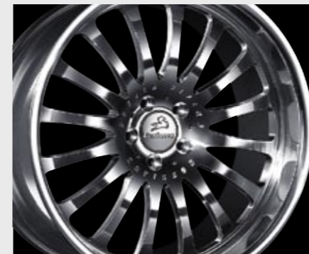
Schmiederad 1/16 Ultra Light (10x19") Forged wheel 1/16 Ultra Light (10x19")