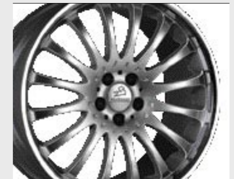
Aluminiumrad 1/16 Brilliant Edition (8,5x18") Aluminium wheel 1/16 Brilliant Edition (8,5x18")